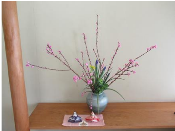
投入 1 昨年の吉田さんの作品