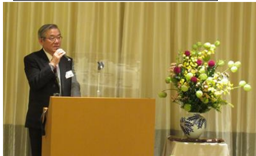
<小川理事長挨拶&総会進行>