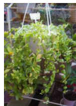
<ビンゴの景品、宝くじ、ペペロミア他>