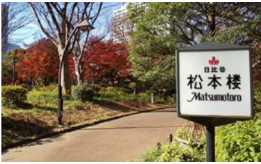
<日比谷公園松本楼>