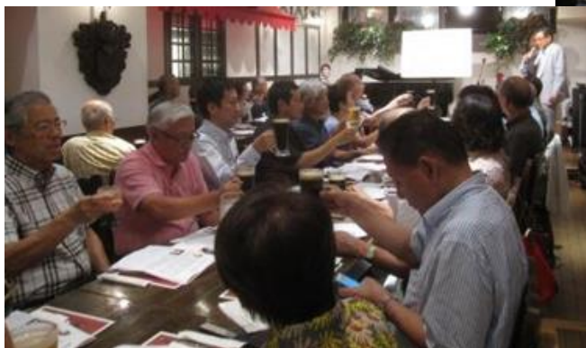
乾杯する参加者の皆さん↑