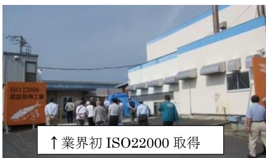
↑ 業界初 ISO22000 取得