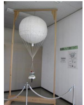
記念館の2階に興味深い展示品がありました。

そこから10分先の大津港入口の松野屋で昼食(お刺身定食)、豪華なお刺身の盛に幹事が料金についてワンランク上げた甲斐が表れました。食事後、再びバスに乗車して、テレビで見っていた