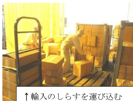
↑ 輸入のしらすを運び込む (於：小松水産)