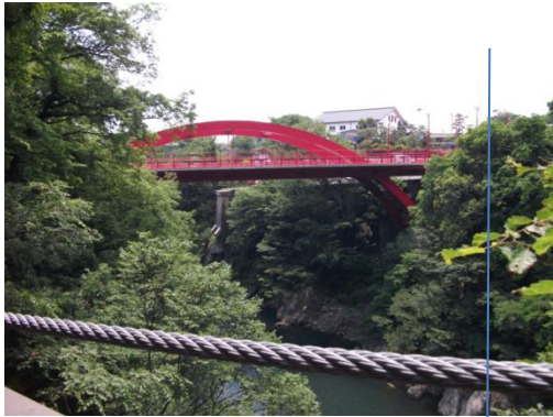
上州物産館での昼食後→おもちゃ自動車博物館（昭和 32・3 年頃）

高津戸峡谷を散策(馬場さん先導、川の岩場にある甌穴(おうけつ)とそこの丸い石を見てあまりの大きさにびっくりして写真に撮りました。この後の大雨はバスの中だけで済んで昼食の場所に移動しました